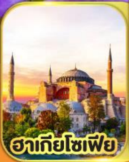
อาทิยโซเฟีย