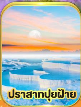
ปราสาทปุยฝาย