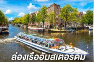
ล่องเรืออัมสเตอร์ดัม

มือพิเศษสุดหรู รับประทานอาหารบนหอไอเฟล พร้อมชมวิวกรุงปารีส