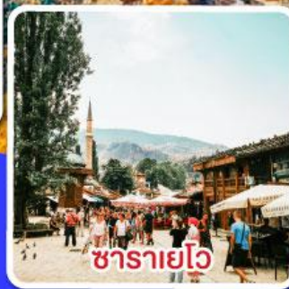
ซาราเยโว