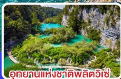
อุทยานแห่งชาติพลิตวิเซ่