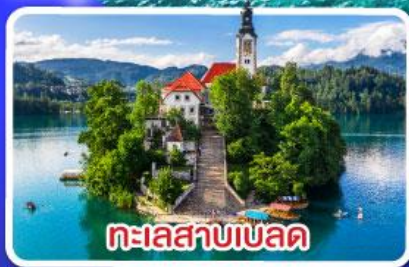
ทะเลสาบเบลล

ไข่มุกแห่ง Adriatic พร้อมขึ้นกระเช้า SRD