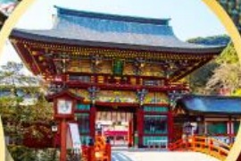
ศาลเจ้ายูโทคุ อินาริ

อิสระท่องเที่ยว ช้อปปิ้งหนึ่งวันเต็มในเมืองฟุคุโอกะ