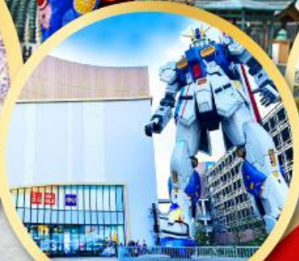
กันดั้ม ปาร์ค ฟุคุโอกะ