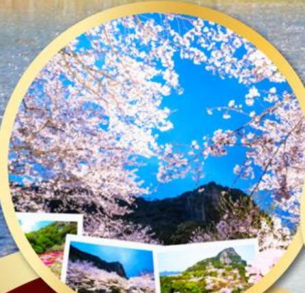
สวนมิฟูเนะยามะ