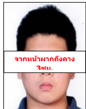
จากหน้าผากถึงคาง 3 ซม.