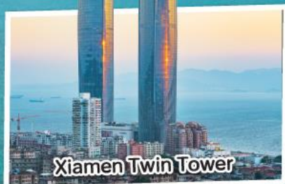
Xiamen Twin Tower