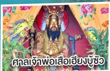
ศาลเจ้าพ่อเสือเอียงบู๊ซิว