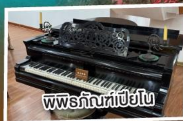
พิพิธภัณฑที่เปียโน

พัก 4 ดาว เมนูพิเศษ!!! เปิดปิกกึ่ง อาหารแต่จิว 18 อย่าง