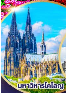
มหาวิหารโคโลญ