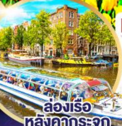
ล่องเรือหลังคึกกระจัก