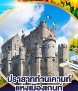
ปราสาทท่านเคานท์แห่งเมืองเกนท์