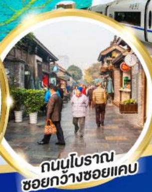
ถนนโบราณ ซอยกว้างซอยแคบ