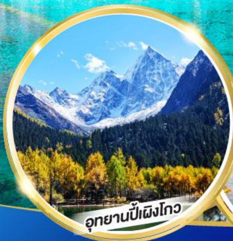
อุทยานปี้ผิงโกว