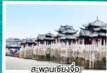
สะพานเซียงจื่อ