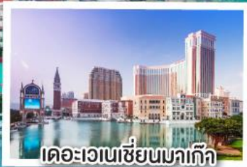
เดอะเวเนเชียนมาเก๊า