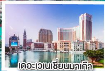
เดอะเวเนเซียนมาเก๊า