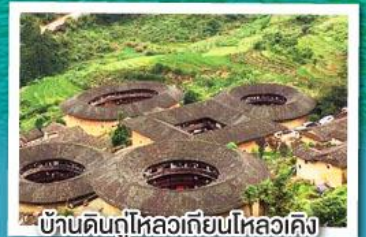
บ้านดินกู่ไหลวเทียนไหลวเคิง