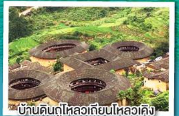
บ้านดินกู่ไหลวเทียบไหลวเค็ง