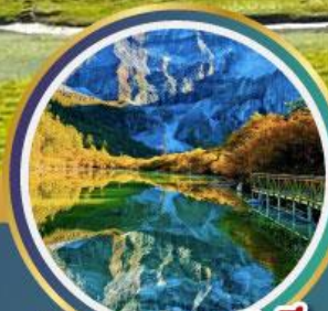
ทะเลสาบ 5 สี