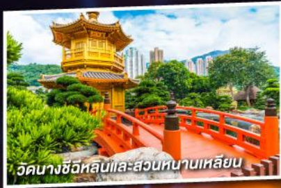
วัดนางชีอิหลินและสวนหยาดเทียน