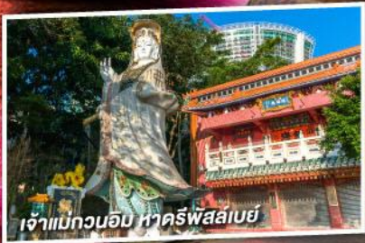
เจ้าแม่กวนอิม หาดริฟส์ลีย์