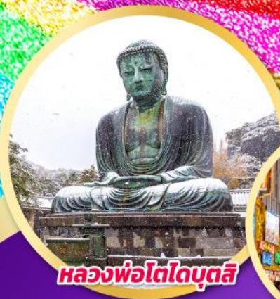
หลวงพ่อโตโคบูตสึ