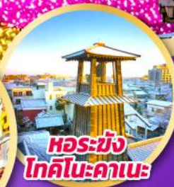
หอรบั้ง โทคิโนะคานะ