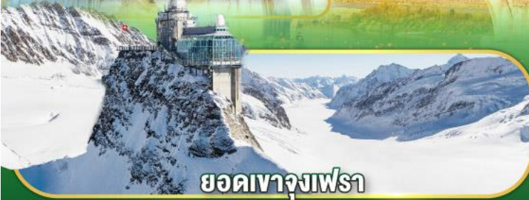
ยอดเขาจุงเฟรา

เข้าชมความงดงามและอลังการ ของพระราชวังแวร์ซายน์