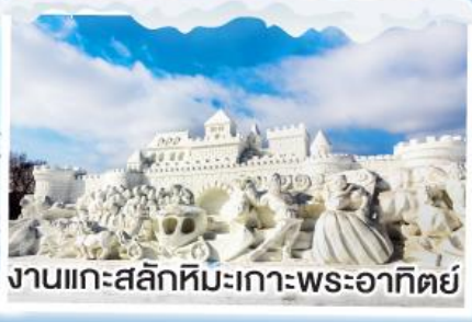
งานแกะสลักหิมะเกาะพระอาทิตย์

งานเทศกาล HARBIN ICE & SNOW FESTIVAL • หมู่บ้านหิมะ • งานแกะสลักหิมะ เกาะพระอาทิตย์ • ถนนรัสเซีย • จัตุรัสโบสถ์เซนต์โซเฟีย