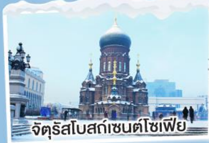
จัตุรัสโบสถ์เซนต์โซเฟีย