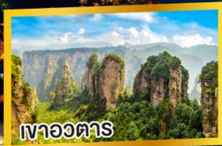
เวาอวตาร