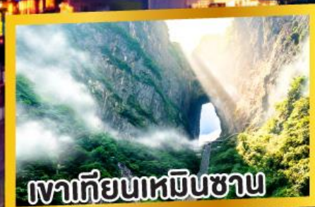
เวาเทียนเหมินชาน