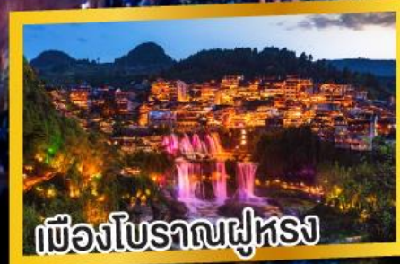
เมืองโบราณฟูหรง