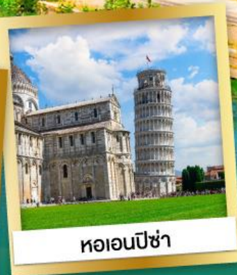
หออนปิซ่า