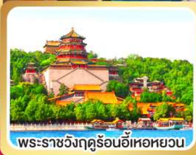
พระราชวังฤดูร้อนอ้าหอยวน