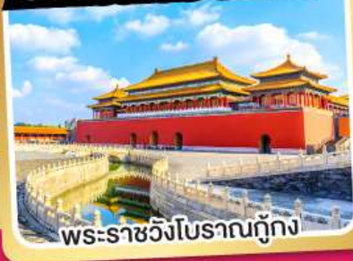
พระราชวังโบราณปักกิ่ง