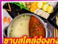
ซาบุดสโด้ฮ่องกง