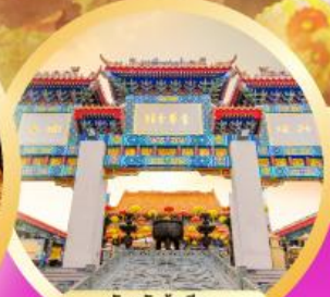
วัดหวังต้าเซียน ขอพรด้านสุขภาพ ความรัก