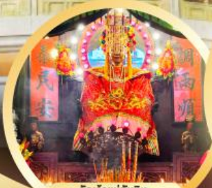
วัดเจ้าแม่กวนอิม ขอพรเรื่องความปลอดภัย ในการเดินทาง การค้าขาย