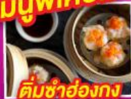
ติ่มซำฮ่องกง