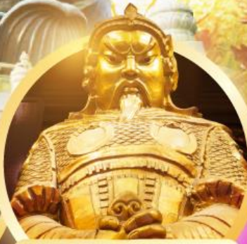
วัดแชกงหมิว ขอพรเทพเจ้าเซ่งก้งปกป้องบิดเป่าอุปสรรค