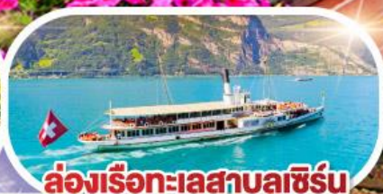
ล่องเรือทะเลสาบลูเซิร์น