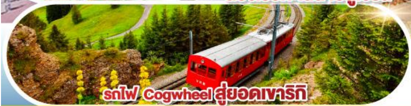
snlw Cogwheel สู้อยอดเขาริกิ