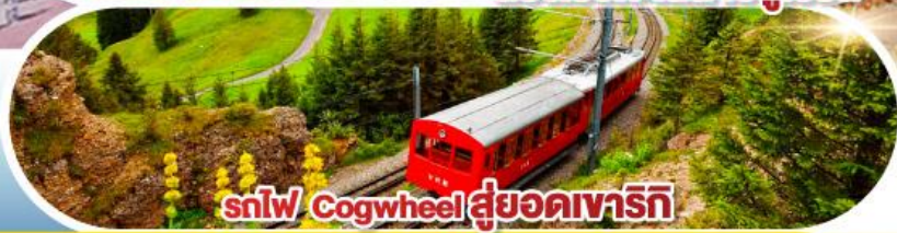
รถไฟ Cogwheel สู่อยอดเขาริกี