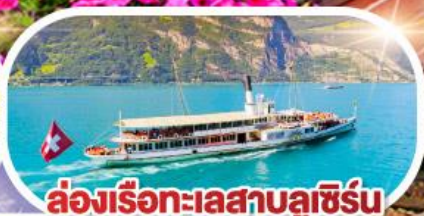
ล่องเรือทะเลสาบลูซิิร์น