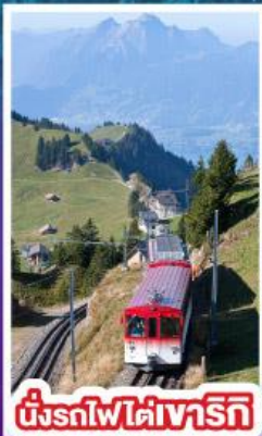
นั่งรถไฟใต้เขาเทริก