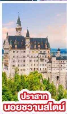
ปราสาท นอยชวานสไตน์