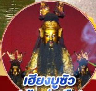
เอียงบูชัว (เจ้าพ่อเสือ)