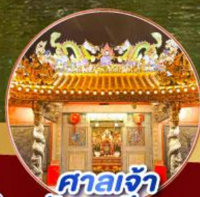
ศาลเจ้า มังกรเขียว