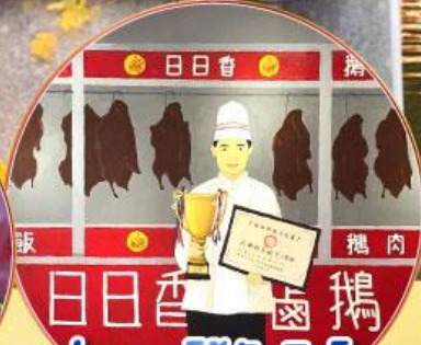
ห่านพะโล้หัวสิงโต ภัตตาคารยี่ ยี่ เชียง

เมนูพิเศษ!!! อาหารตัวจิว 18 อย่าง ห่านพะโล้หัวสิงโตต้นตำรับชิวเถา, สุกี้ซีฟู้ด