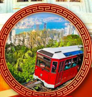
วัดตอเรียพิค+แถม รถรางนั่งขึ้นเขา ชมวิวเมืองสวยๆ