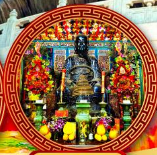
วัดปึกโต ขอพรเรื่องความสำเร็จ การงาน