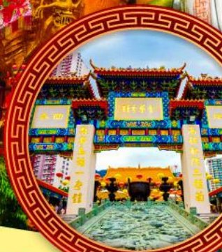
วัดหวังต้าเซียน ขอพรสุขภาพ ความรัก