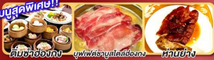
ติ่มซำฮ่องกง