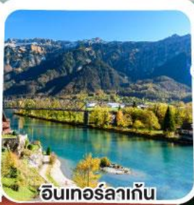
อินเทอร์ลาเก้น