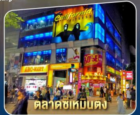
ตลาดซีเหมินตง