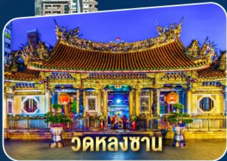
วัดหลงซาบ