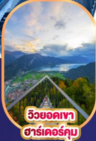
วิวยอดเขา ฮาร์เตอร์คุม