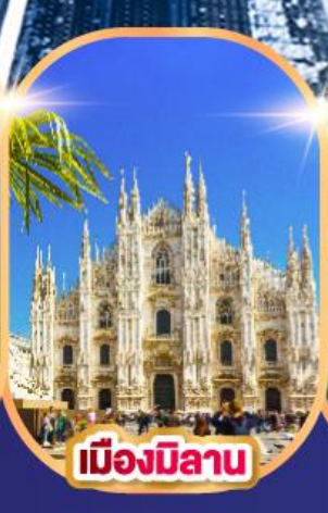
เมืองมิลาน