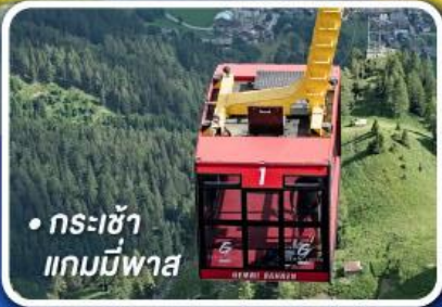
• กระเช้า แกมมีพาส