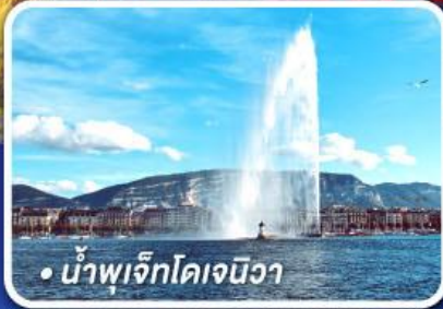
• น้ำพุเจ็กโดเจนิวา