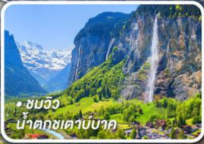
• ชมวิว น้ำตกเขาบับบาค

กับรถไฟด่วนขบวนสวรรค์ เซอร์แมท-อันเดอร์แมท