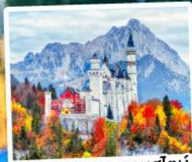
ปราสาทน้อยชวานส์ไตน์

09-15, 15-21 ต.ค. 68 23-29 ม.ค. / 25 ก.พ.-03 มี.ค. 69 06-12, 18-24 มี.ค. 69 01-07, 09-15, 10-16, 12-18 เม.ย. 69 29 เม.ย.-05 พ.ค. / 30 เม.ย.-06 พ.ค. 69 28 พ.ค.-03 มิ.ย. 69