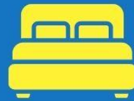
ห้องพักดับเบิล DOUBLE