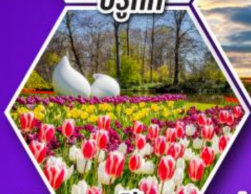
เทศกาลดอกไม้เคอเคนฮอฟ