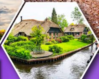
หมู่บ้านกังหัน