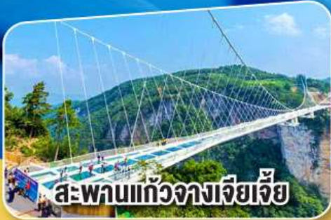
สะพานแก้วจางเจียเจีย