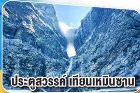
ประตูสวรรค์เทียนเหมินซาน