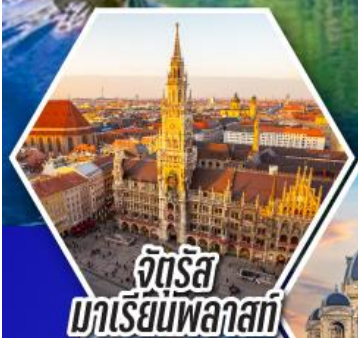
จตุรัส มาเรียนพลาซาร์