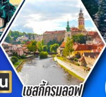
เซสท์ครุมลอฟ