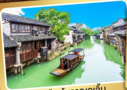
เมืองโบราณอู๋จิ้น