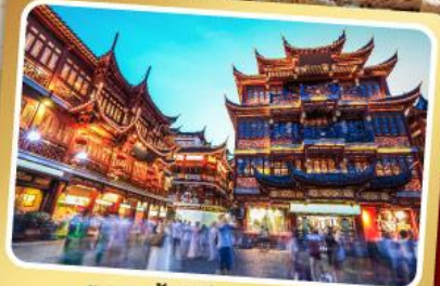
ตลาดร้อยปีเงินหวังเมี่ยว