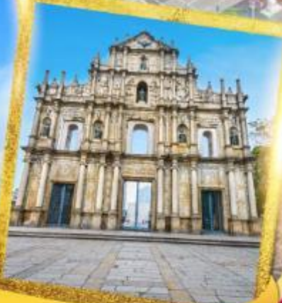
วิหารเซนต์ปอลเซนต์ปอล