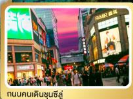
ถนนคนเดินชุนชี่