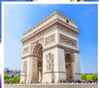
ประตูชัยปารีส