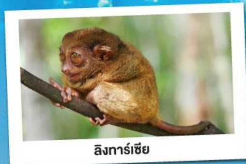
ลิ่งทาร์เซียร์