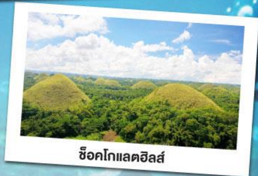
ช็อคโกแลตฮิลล์