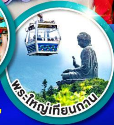
พระใหญ่เทียนถาน