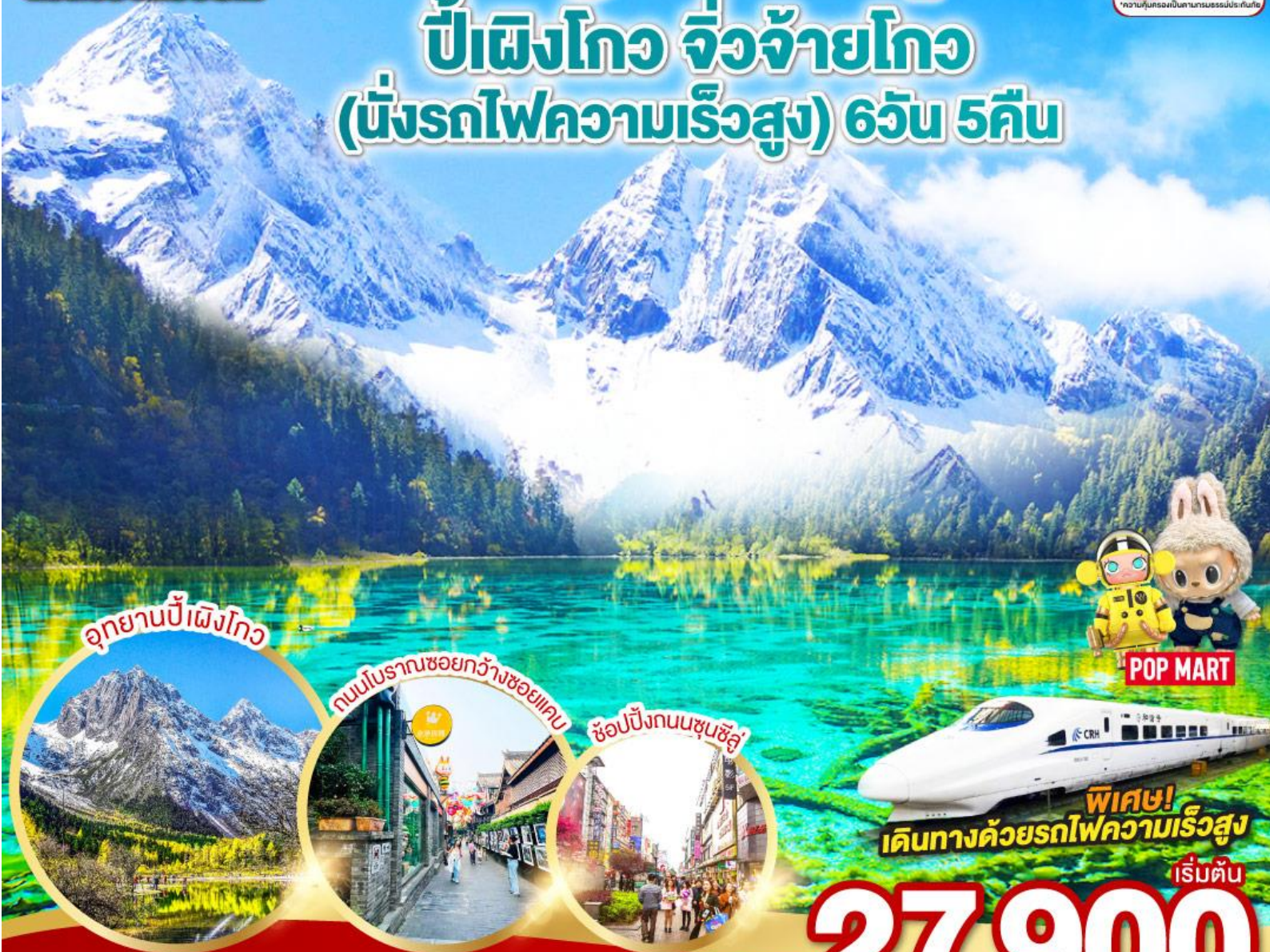
อุทยานปี๋เฉิงโกว

ประกันสุขภาพและอุบัติเหตุ 3,000,000 *ความคุ้มครองเป็นไปตามกรมธรรม์ประกันภัย