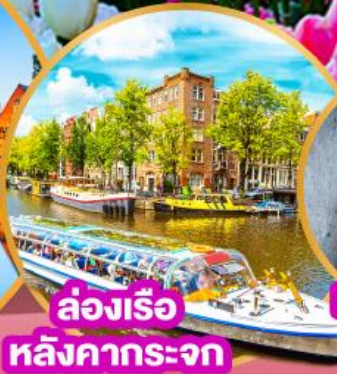
ล่องเรือ หลังคากระจุก