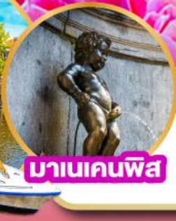
มานเคนพิส