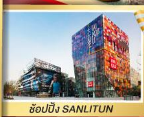
ช้อปปิ้ง SANLITUN