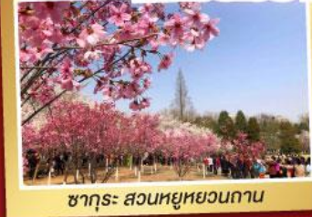
ซากุระ: สวนหยูหยวนถาน

จ่ายราคาเดียว..เที่ยวเต็มอิ่ม ..ไม่ลงร้านช้อปปิ้ง