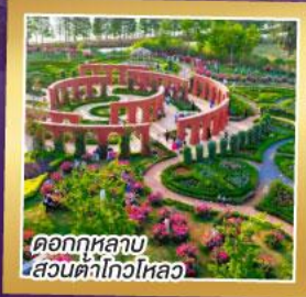
ดอกกุหลาบ สวนต้าโกวไหลว