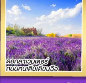
ดอกลาเวนเดอร์ ถนนคนเดินเตียนฉือ