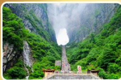
ประตูสวรรค์ เทียนเหมินซาน