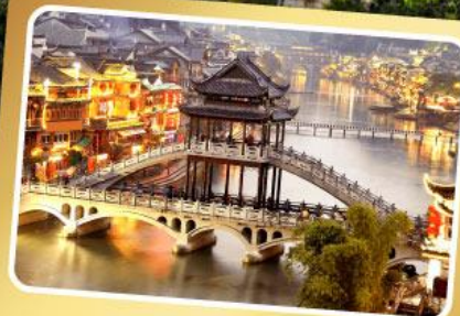
เมืองโบราณฟังหวง