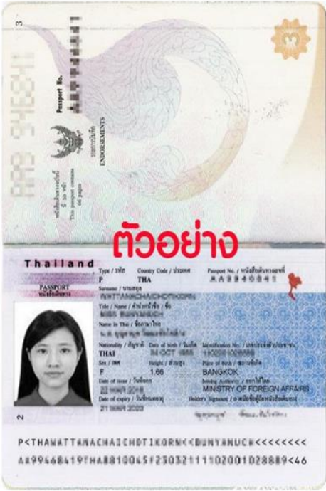
ตัวอย่าง สแกนหน้าพาสปอร์ต หน้าเต็ม 2 หน้า

1. สำเนาหนังสือเดินทางที่มีอายุเหลือมากกว่า 6 เดือน (สำเนาให้ตรงไม่ตกขอบ สำเนาเป็นรูปสี่เหลี่ยม ลูกค้าไม่ต้องสอ พาสปอร์ตเล่มจริงให้บริษัท และสำเนาให้ติดก๊อ 2 หน้าก๊อ ตัวอย่าง)