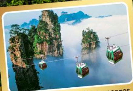
กระเช้าลอยฟ้า หุบเขาอวตาร

ฉางซา จางเจียเจีย ฟังหวง นั่งรถไฟความเร็วสูง