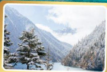
ทะเลสาบยาว