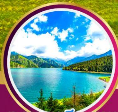
ทะเลสาบเทียนชาน