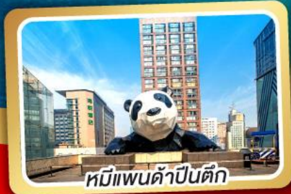
หมีแพนด้าปิ่นตึก