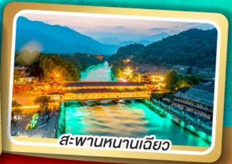
สะพานหนานเจียว