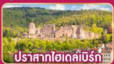
ปราสาทไฮเดิลเบิร์ก