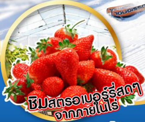
ชิมสตรอเบอร์รี่สดๆ จากภายในไร่