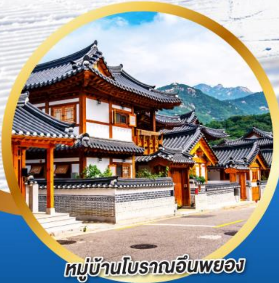
หมู่บ้านโบราณอินพยอง